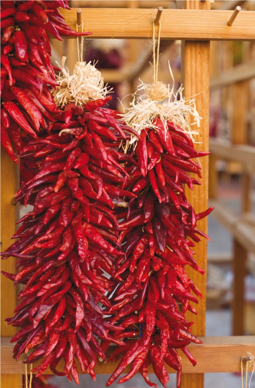
Chiles secos en un mercado de México