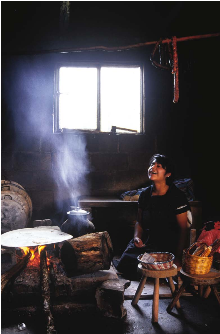
Una mujer de Chiapas hace tortillas en casa