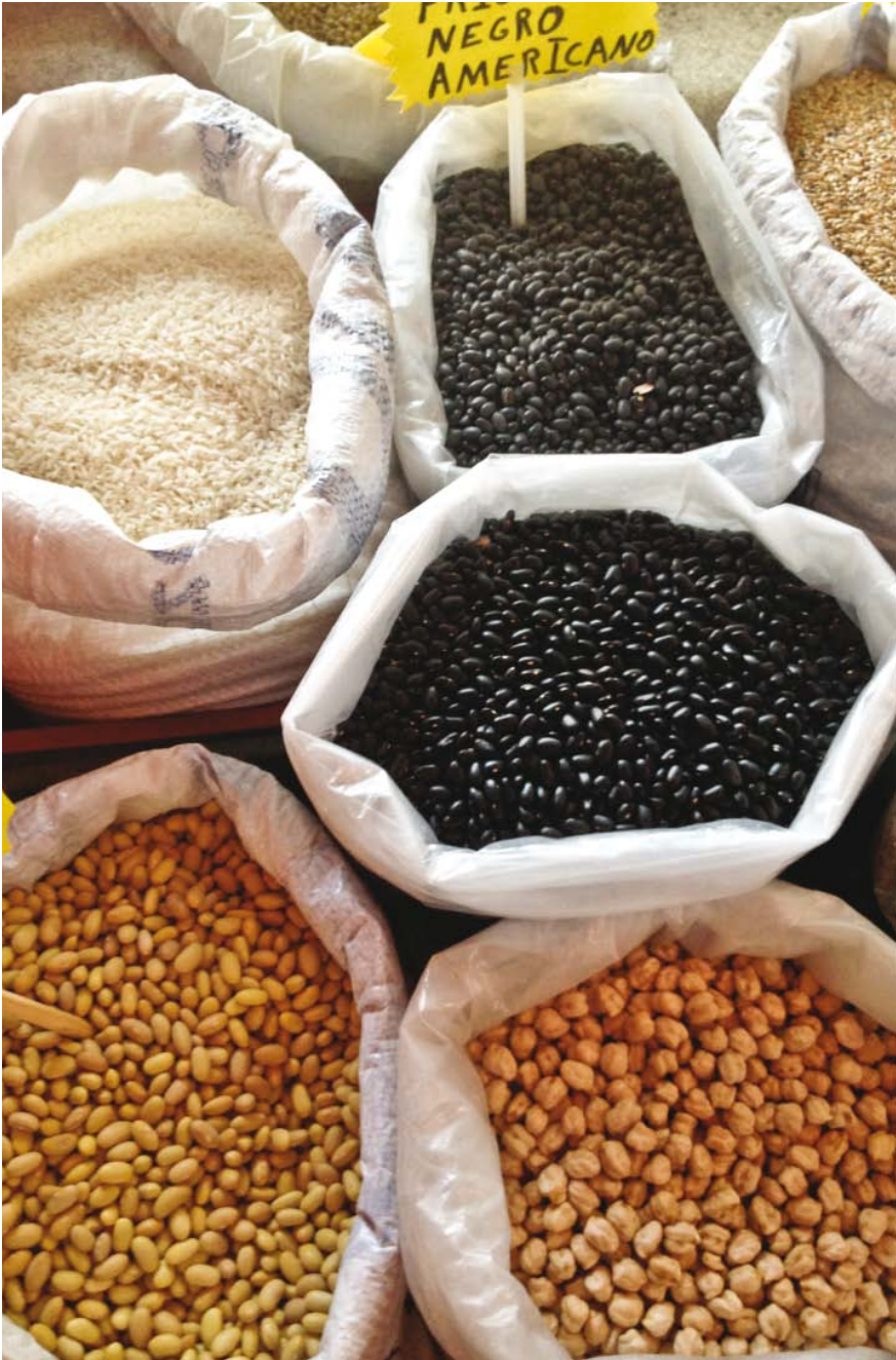
En los mercados, las legumbres se venden a peso