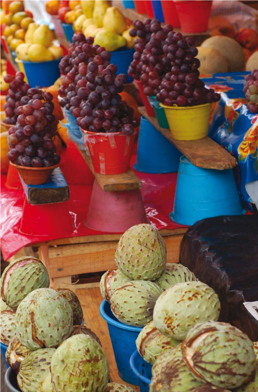
Un puesto callejero de fruta